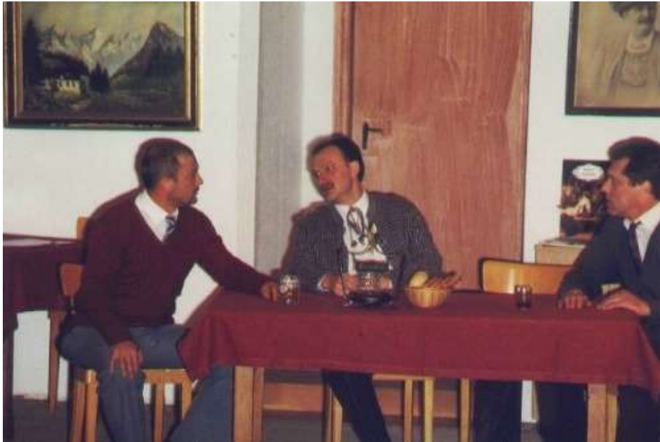
Kein Platz für Idioten 1996