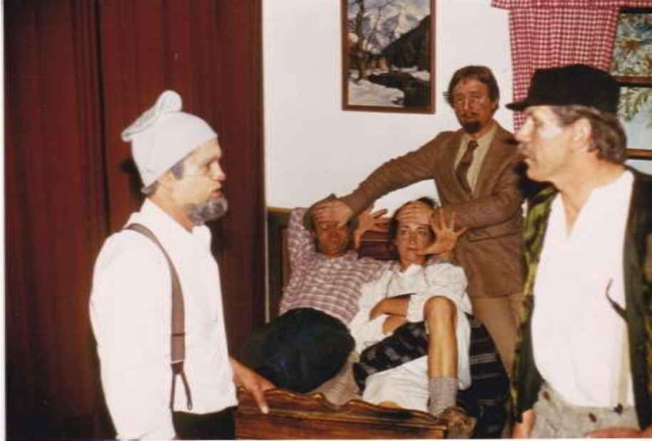
Warum - darum 1980