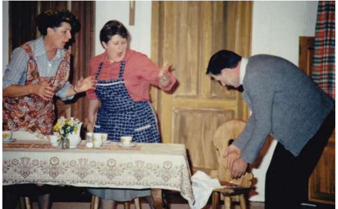
Der schwarze Vogt 1991