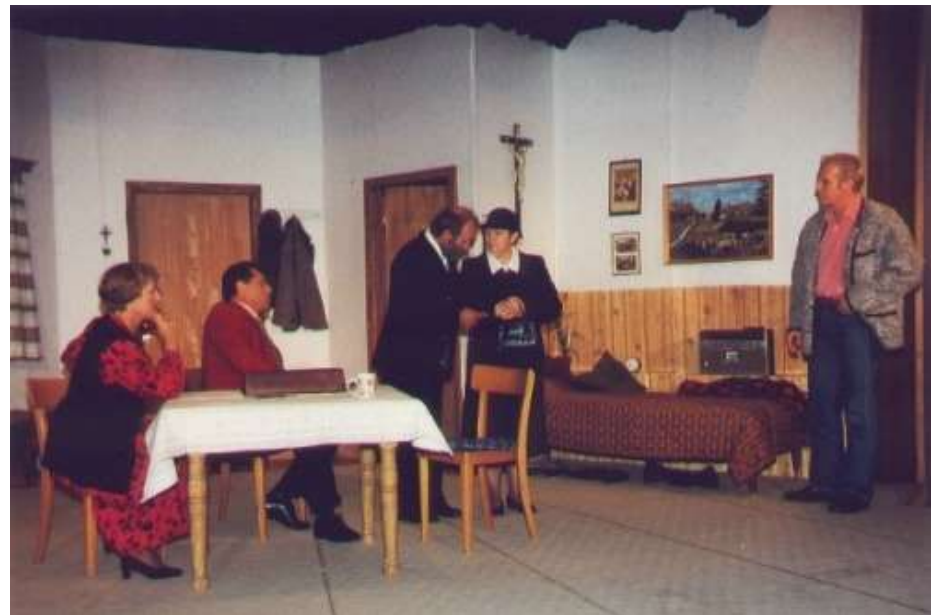
Sei decht nit so dumm 1998