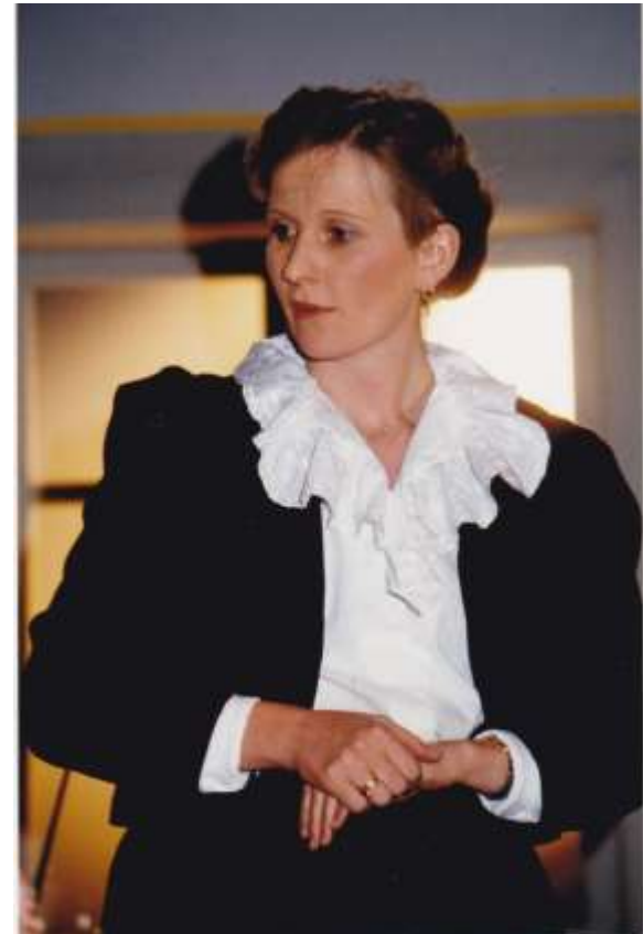
Besuchszeit- Weizen auf der Autobahn 1989