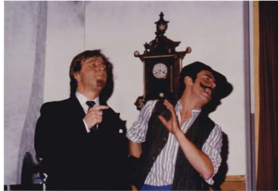
Geld für's Finanzamt 1981