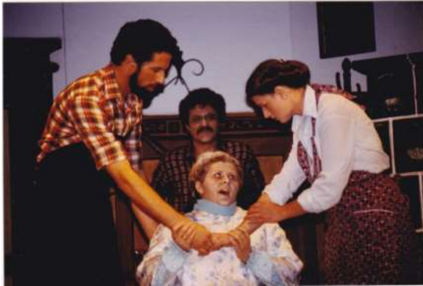
Die Teufelsdirn 1980