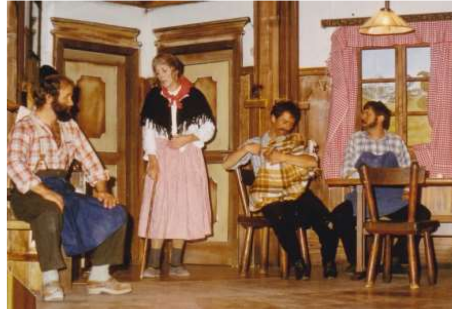
Die drei Eisbären 1981