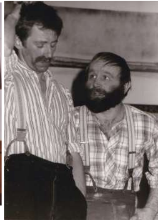
Das Wolkenguckerl 1982