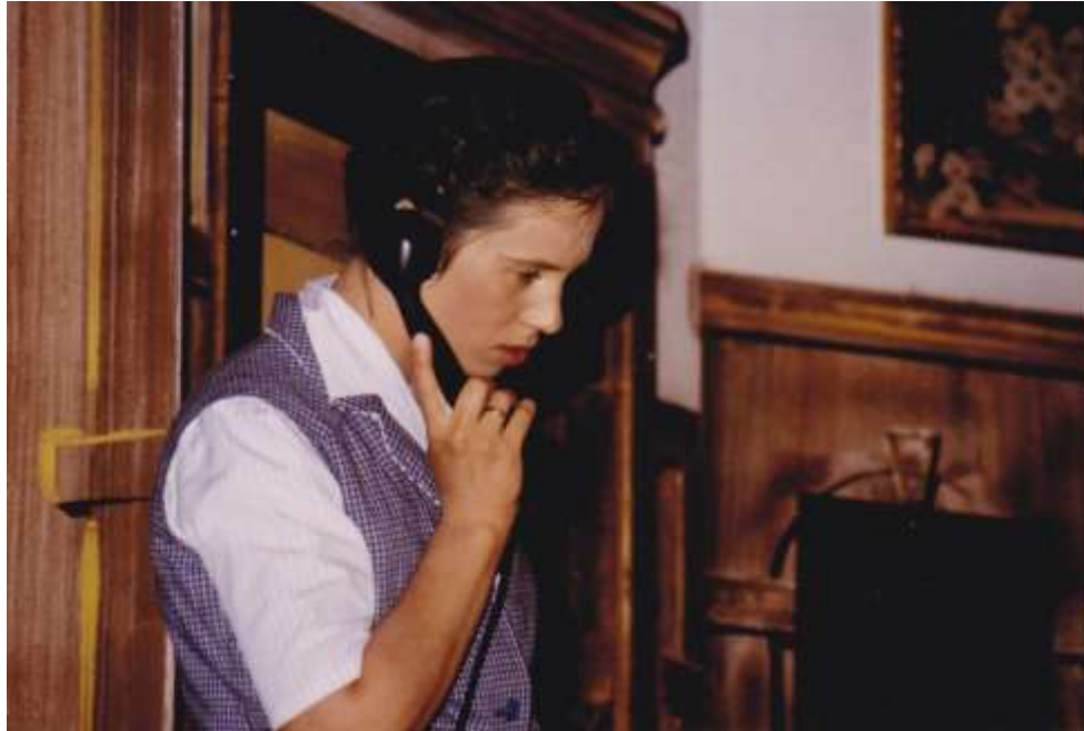
Opa will heiraten 1981