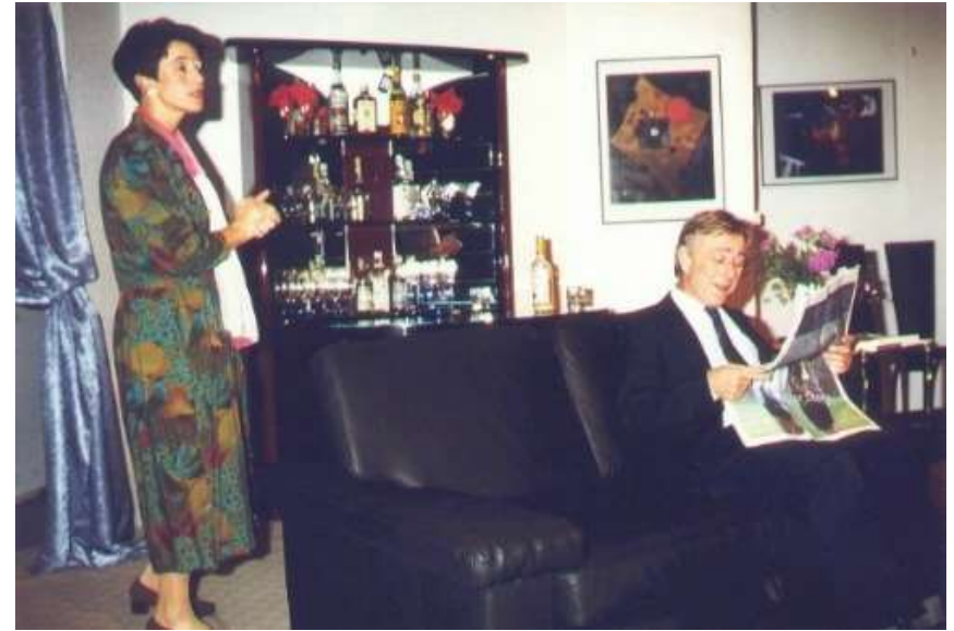
Der Mustergatte 1995