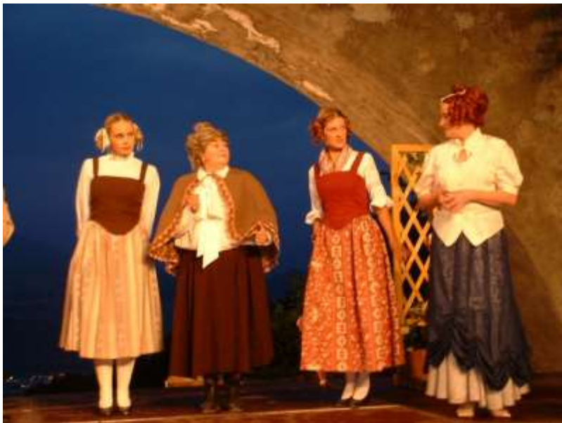
Das Mäd'l aus der Vorstadt 2003/04