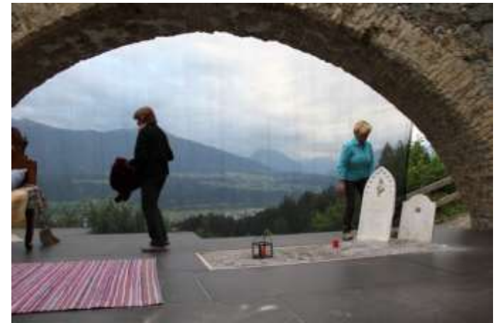
Mein Ungeheur - Regieassistenz 2010