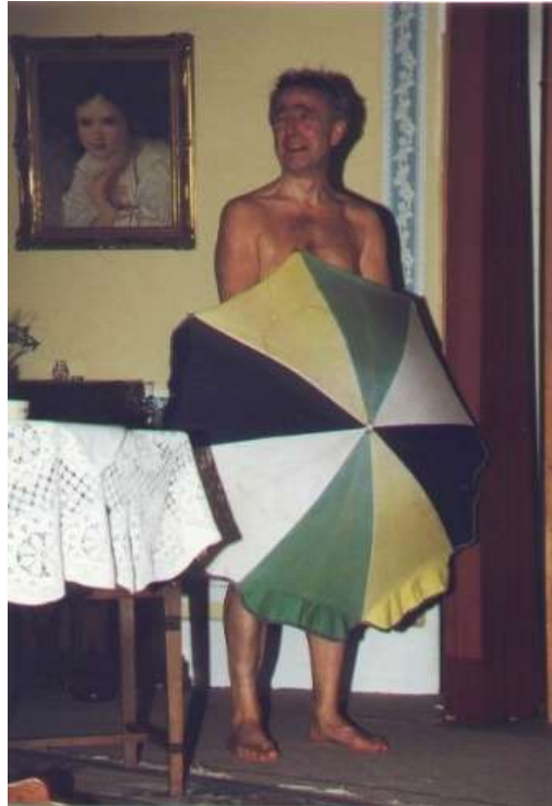
Geld wie Heu 1998