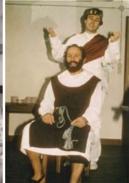
Das Wolkenguckerl 1982