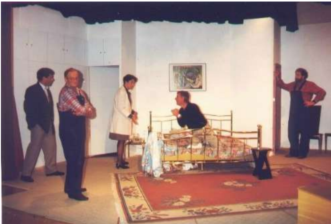
Als Statist bei „ Der Mustergatte“ 1995