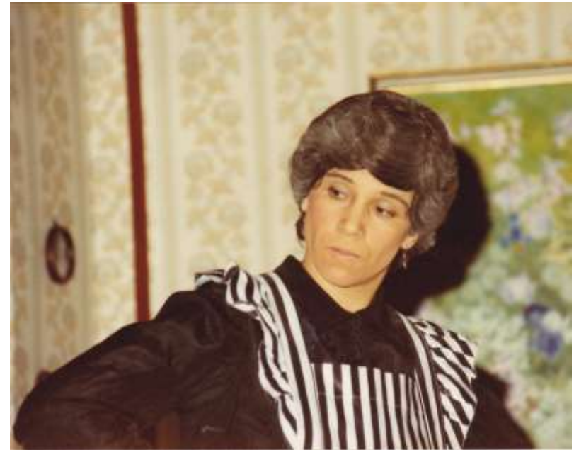
Die schleichende G´ sundheit 1982