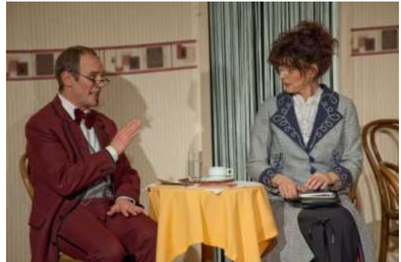
Pension Schöller 2010