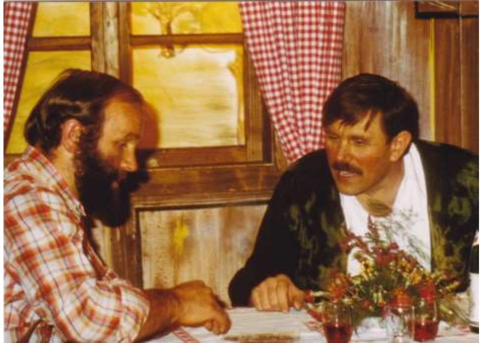
Die drei Eisbären 1981