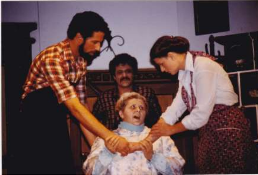
Die Teufelsdirn 1980