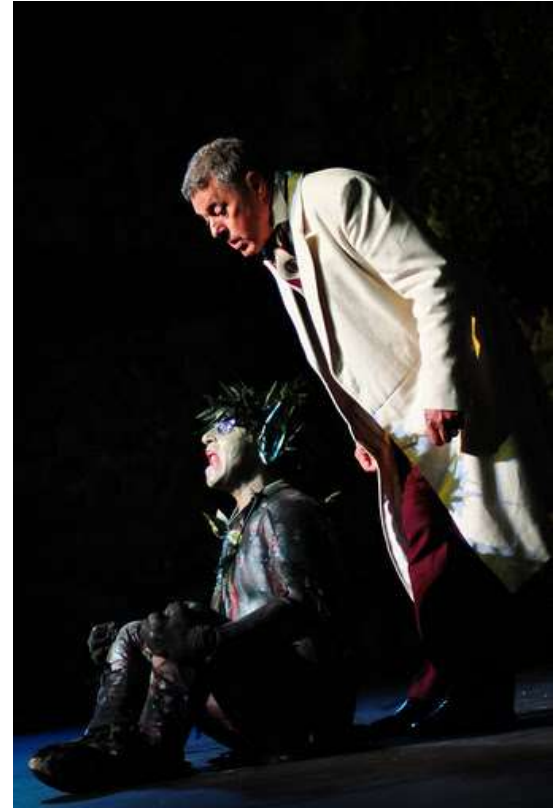
Der Traum einer Sommernacht 2011