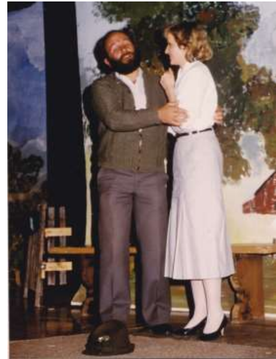
Das Verlegenheitskind 1986