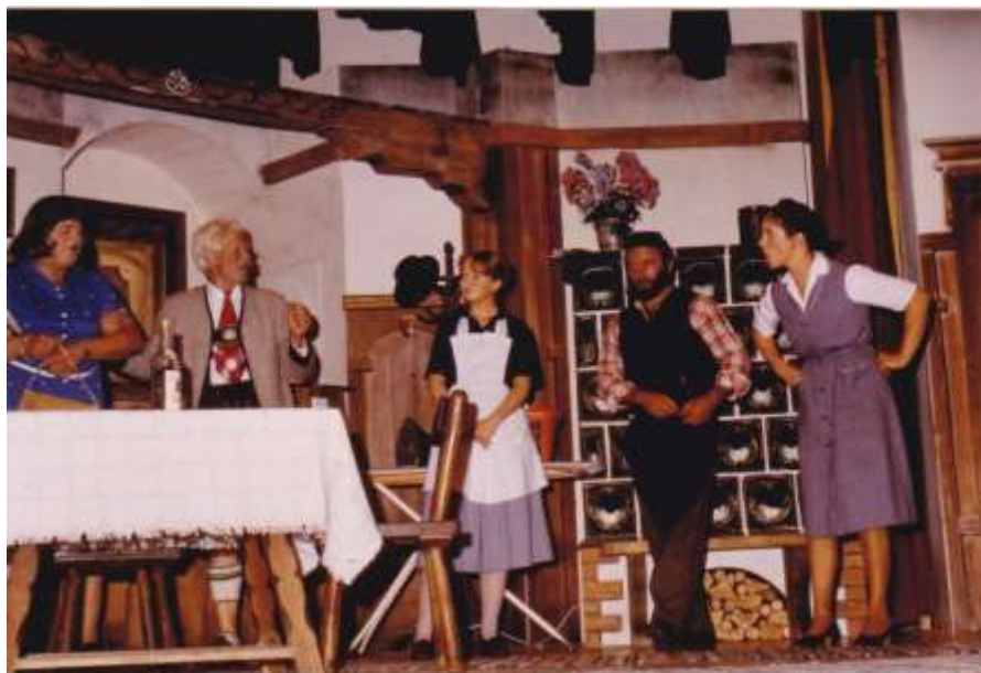
Opa will heiraten 1981