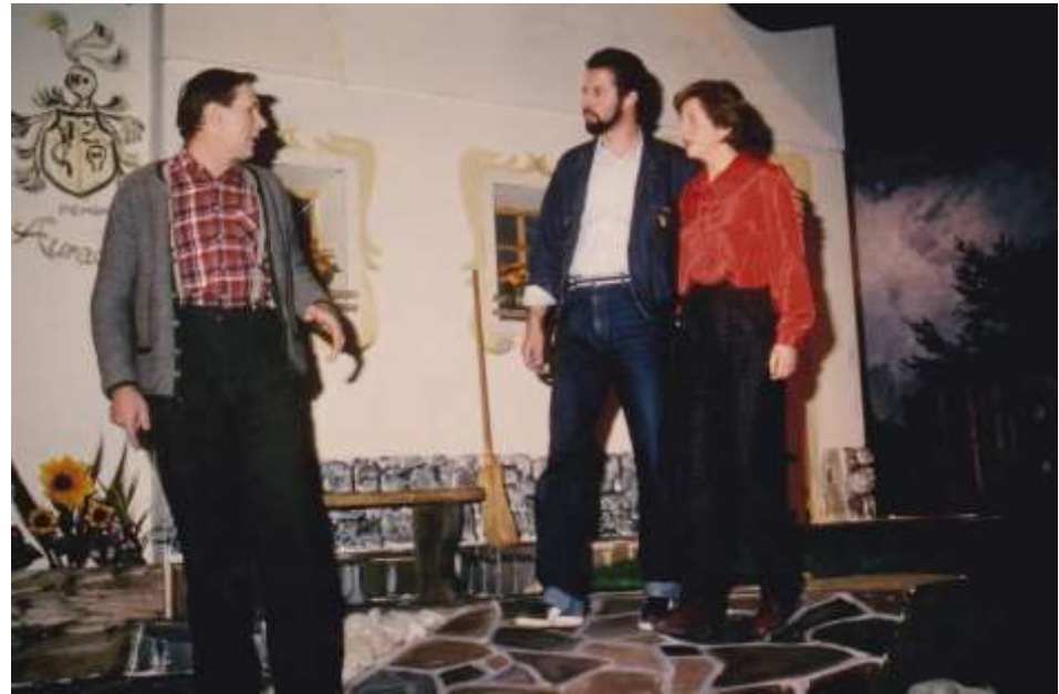
Das Erbe der Väter 1985