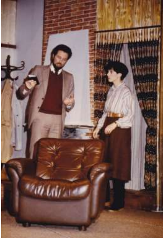
Die Falle 1985