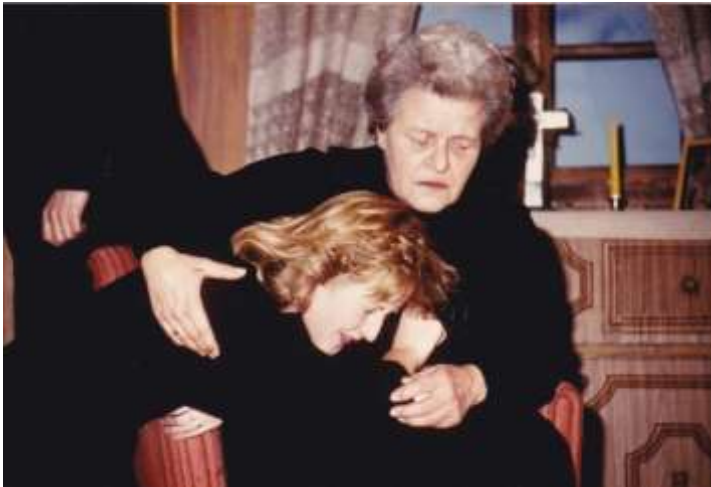
Der Fremde 1986