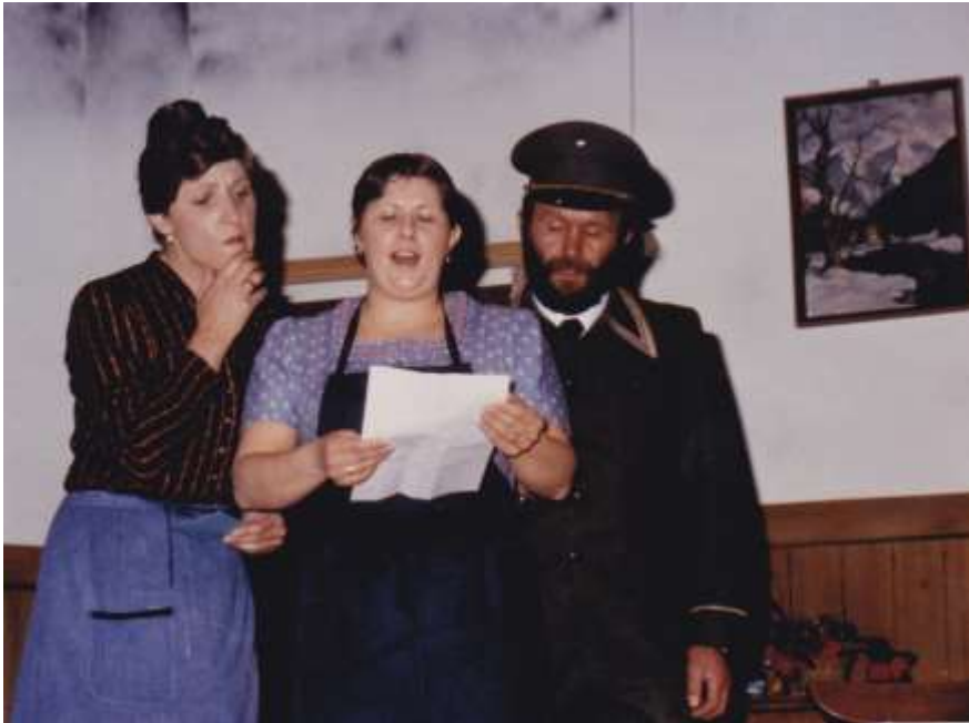
So a Hetz war no net da 1981