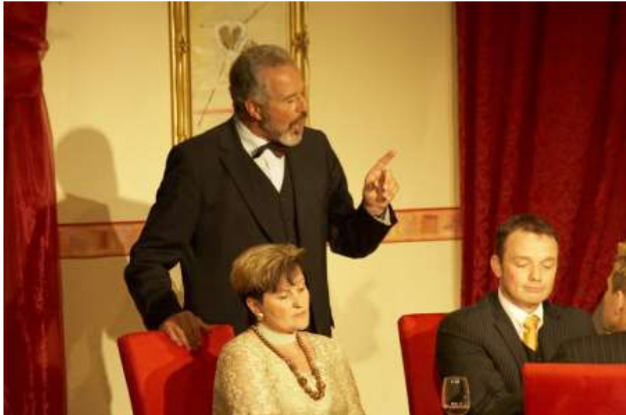
Ein Inspektor kommt 2007