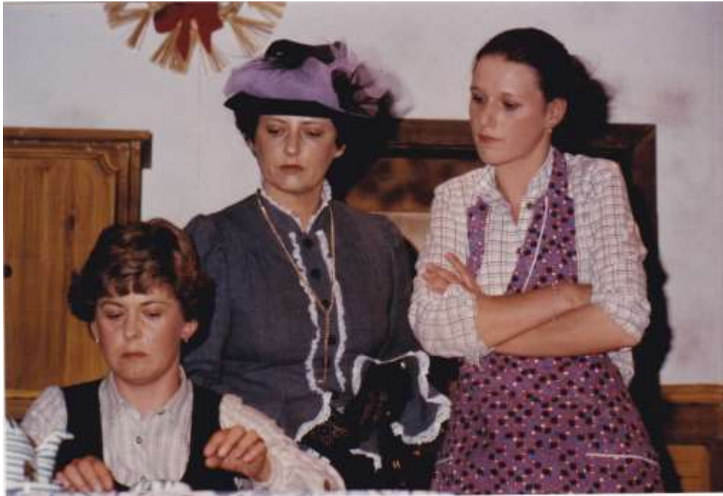
Geld für's Finanzamt 1980