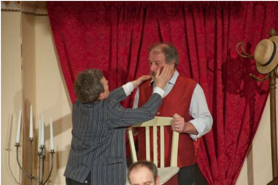
Als Statist bei „Pension Schöllner“ 2010