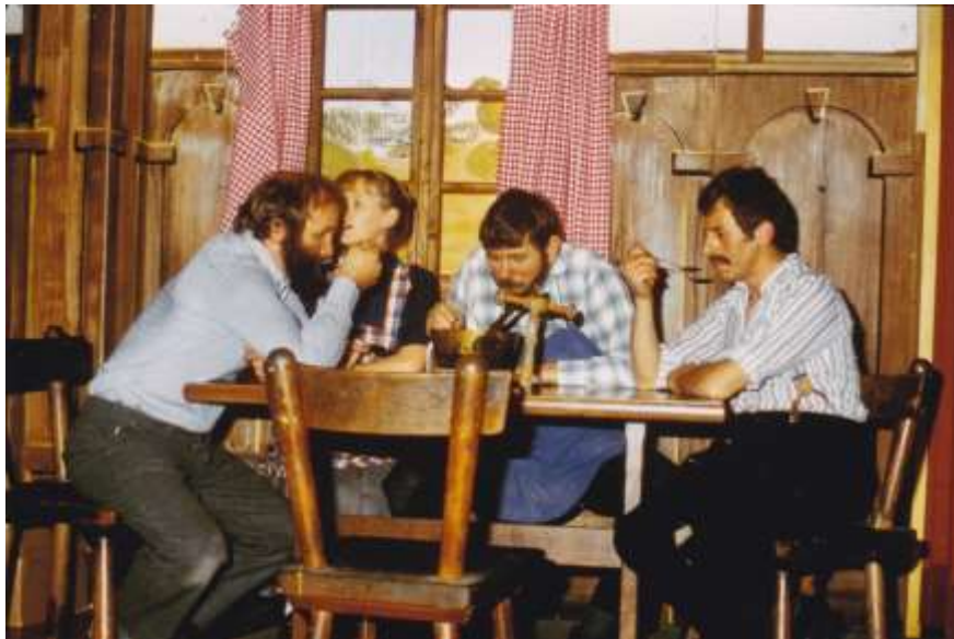
Die drei Eisbären 1981