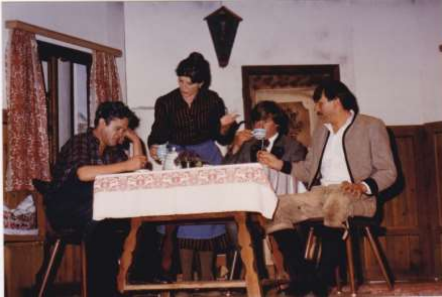
So a Hetz war no net da 1981