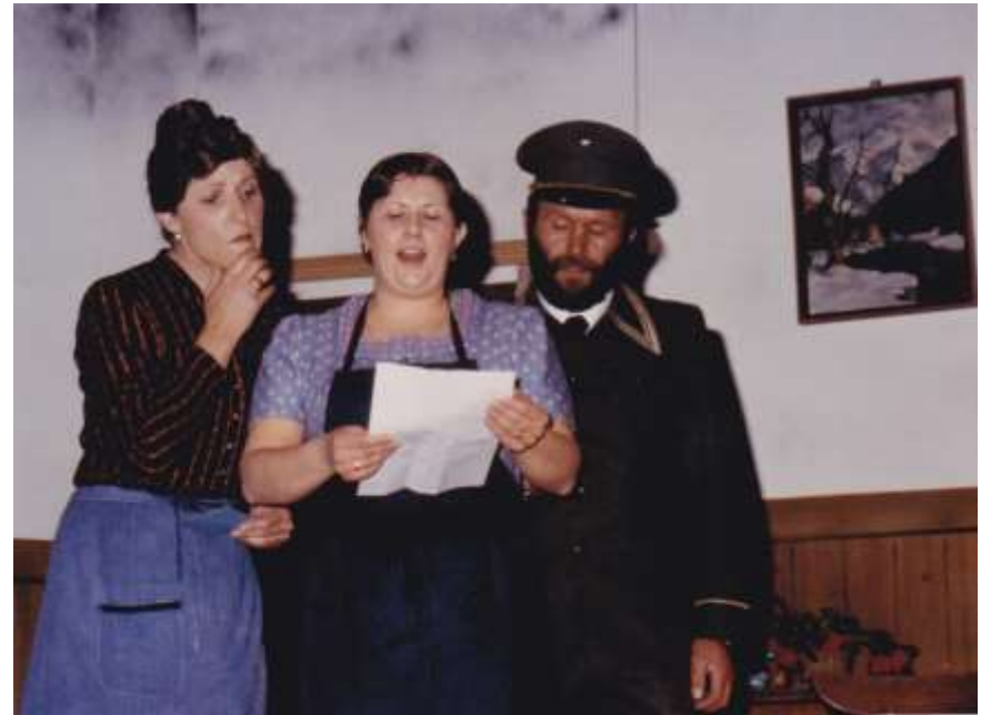
So a Hetz war no net da 1981