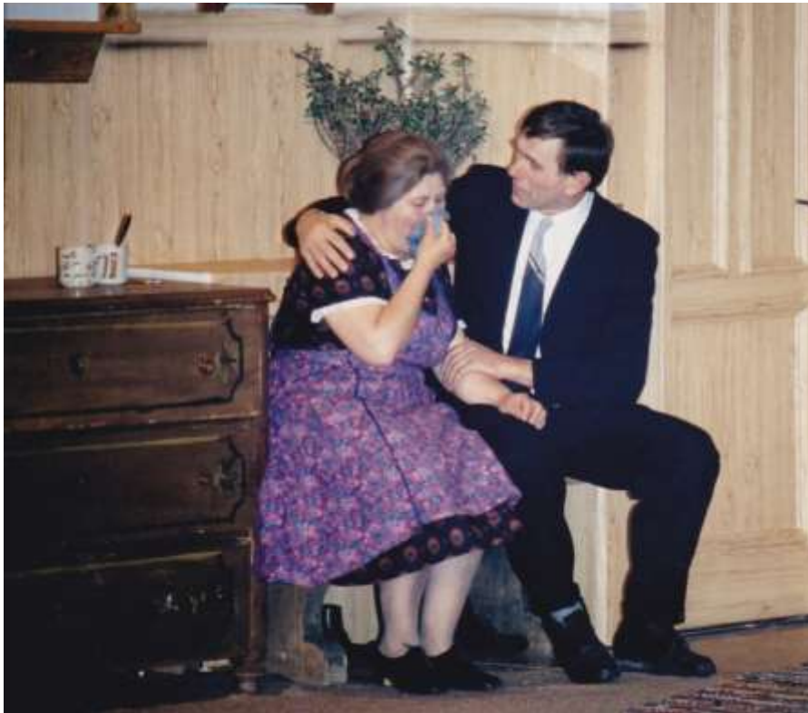
Die Jungferwallfahrt 1990