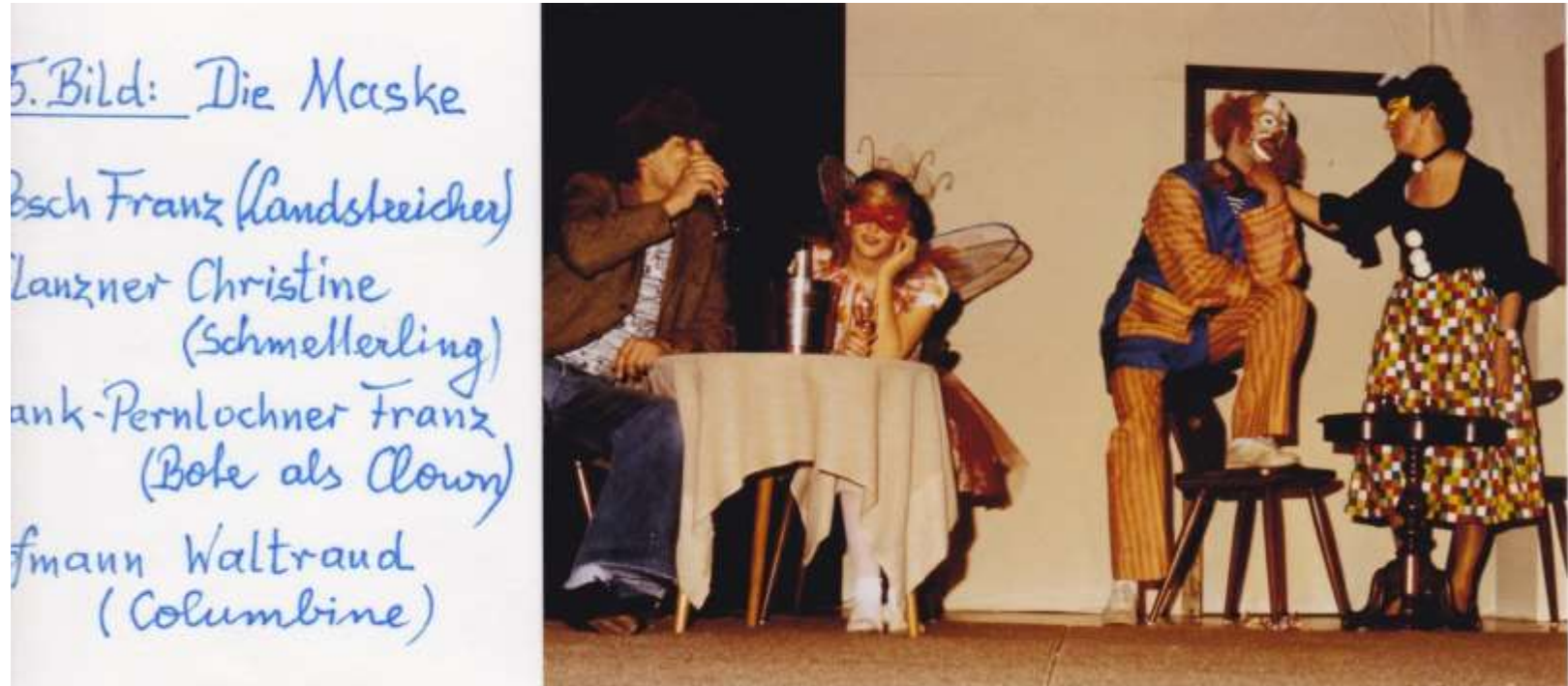
Du wirst nicht gefragt - Mitten im Leben 1982