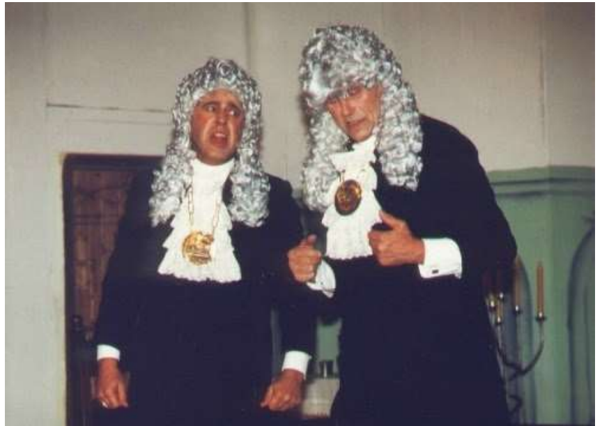
Der Rattenfänger von Hameln 1996