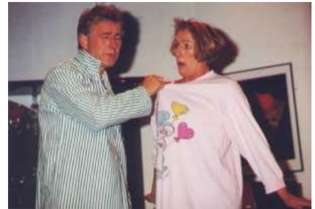
Der Mustergatte 1995