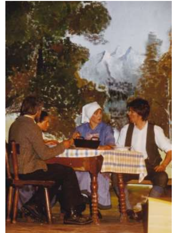
Der Ziegenpeter auf der Zauberalm 1981