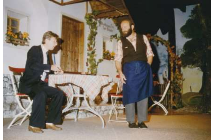
Schwindel in St. Wendelin 1987