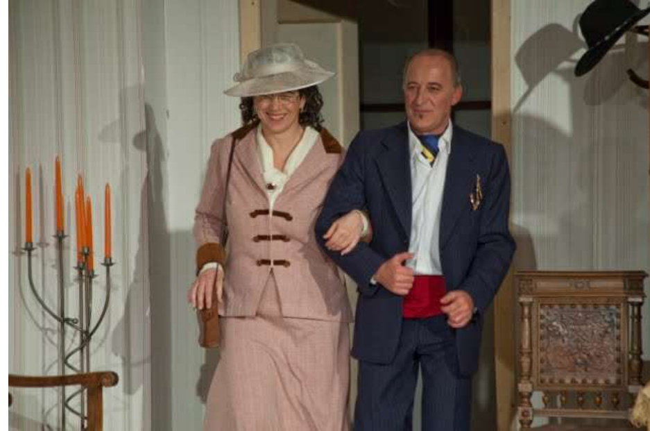
Pension Schöllner 2010