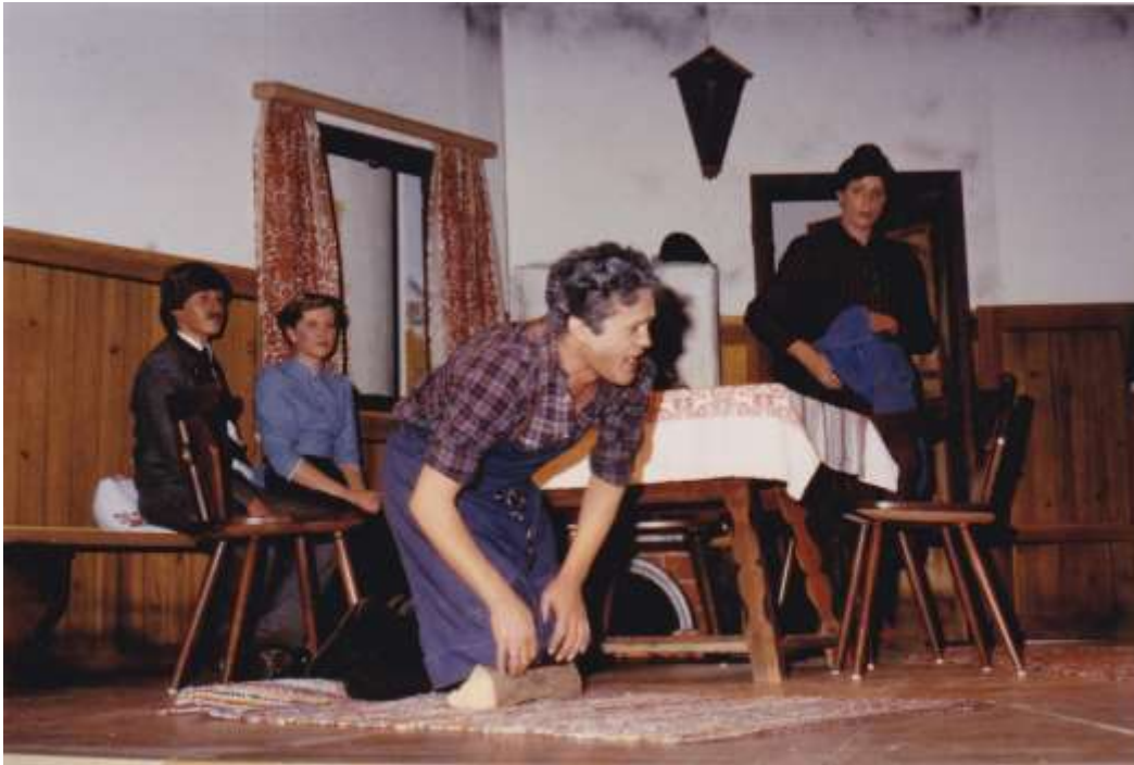
So a Hetz war no net da 1981