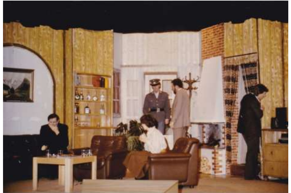
Die Falle 1985