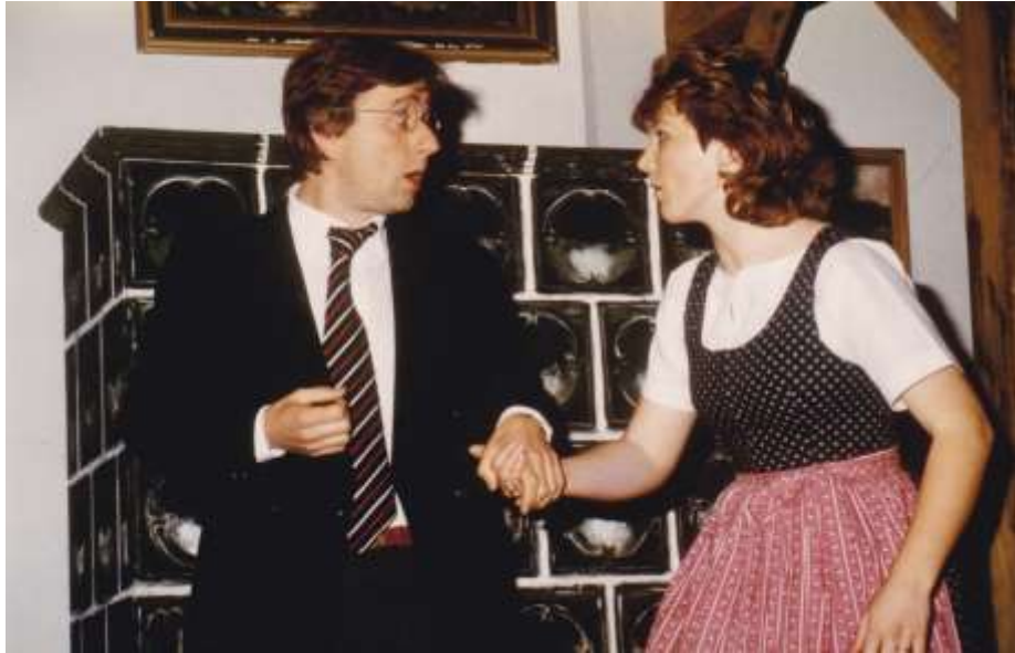
Hurra Zwillinge 1985